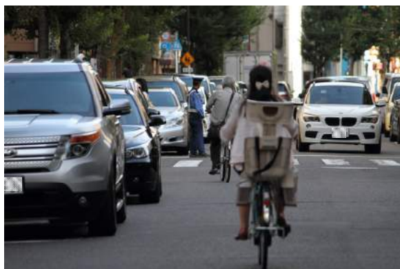
一方通行の左右に路上駐車があふれ、それを避けて道路の中央を走る自転車。その正面から対向車も。 ※公開組分けテスト会場（東京）にて

万が一にも事故を起こさない—そのためには四谷大塚・塾・会場関係者だけでなく、保護者の皆さま一人ひとりの協力が欠かせないことをご理解ください。