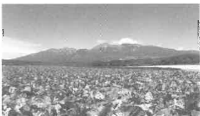
写真2 野辺山原のレタス畑

(1) 空欄( A )と( B )に当てはまる語句を、次の語群から1つずつ選んで答えなさい。