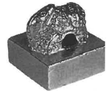
資料2 「漢」の文字が刻まれた 志賀島から出土した金印

A 倭の国には、当時の中国と関係を持った国が存在していた。 B 倭の国には、対外関係を持った国はなく、独自にさかえていた。 C 金印が出土された志賀島の場所は、現在の九州地方にあたる。 D 金印が出土された志賀島の場所は、朝鮮半島にあたる。