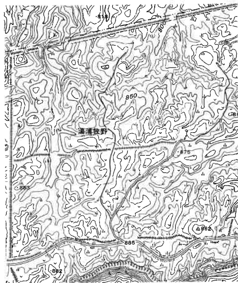
(国土地理院発行 2万5千分の1地形図より)