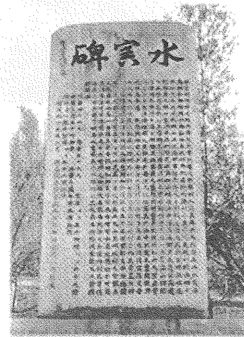
「国土地理院」ホームページ https://www.gsi.go.jp/bousaichiri/denshoji.html より引用

問7 文章中の下線部Gについて、以下の写真は広島県安芸郡坂町で明治40年7月に災害が発生したことを示した石碑です。この場所は2018年7月の西日本豪雨でも同じように被災しました。このように過去の自然災害を教訓として被害の軽減を目指すために、2019年に国土地理院が発表した新しい地図記号として正しいものをア～エから1つ選び、その記号を答えなさい。