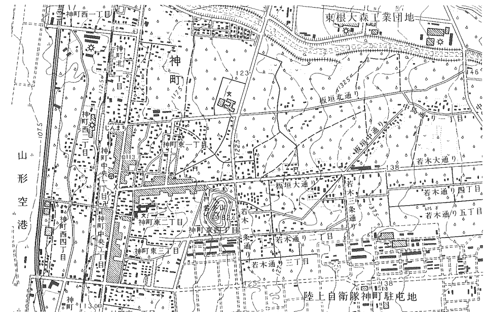
国土地理院2万5千分の1『天童』を使用

問8. 上の地図で、じんまち駅から東方に位置する学校までは、地図上で4cmです。実際の距離を解答欄にしたがって答えなさい。