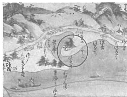
(『西海航路図巻』より作成)

① 日明貿易における交易品について述べた文として誤っているものをア～エから1つ選び、記号で答えよ。